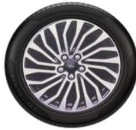
17" Titanium Opció