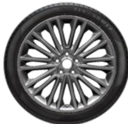
Méret 18" Széria Vignale Kategória Standard