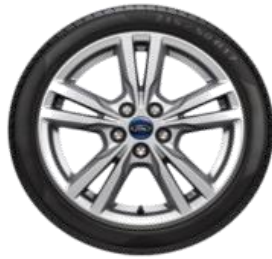
Méret 17" Széria Titanium Kategória Standard

Érvényes: 2022. május 2-i gyártástól A változtatás jogát fenntartjuk!