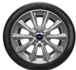
19" Vignale Opció