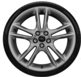
19" ST-Line Opció