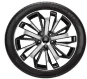
18" Titanium Opció